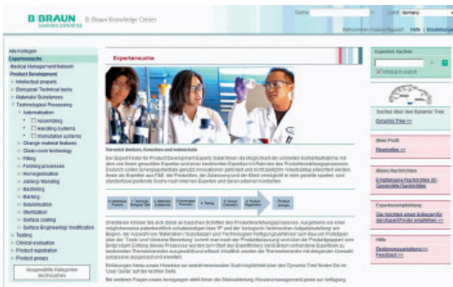
Startseite des Expert Finder – Bereich Product Development

finebrain AG Leimenstrasse 29 CH – 4051 Basel Telefon: +41 (0)61 22694-10 E-Mail: alex.hatebur@finebrain.com www.finebrain.com